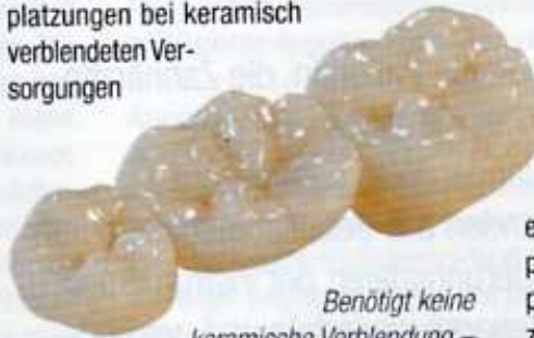
Benötigt keine keramische Verblendung – die vollanatomisch gefräste BruxZir-Brücke

Laut Pressemitteilung der Böger Zahntechnik GmbH & Co. KG, Hamburg, sind die neuen Böger-BruxZir-Kronen und -Brücken ideal für Knirscher und Bruxer. Gerade beim nächtlichen Knirschen könne es zu Abplatzungen bei keramisch verblendeten Versorgungen